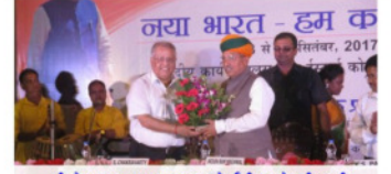
श्री मेघवाल का स्वागत करने ईसीएल के सीएमडी