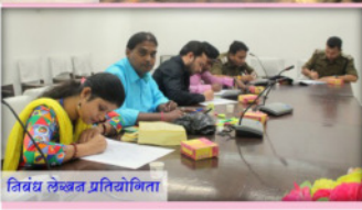
त्रिवेध लेखन प्रतियोगिता