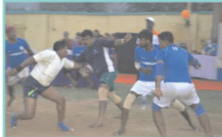
कबड्डी के फाइनल मुकाबले में बांकोला टीम ने पांडवेश्वर टीम को हराकर ईसीएल बैपिचल का खिताब अपने नाम किया