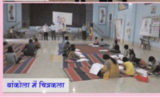
बांकोला में चित्रकला