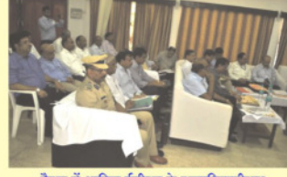
बैठक में शामिल ईसीएल के उच्चाधिकारियों